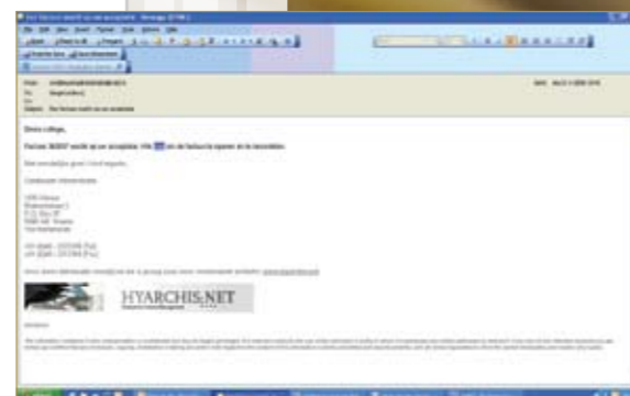
Voorbeeld van een e-mail met een link naar de factuur en verzoek deze te controleren.

Op basis van de herkende waarden van de factuur kan de automatische routing worden gestart. Indien alle vereiste informatie van de factuur juist is herkend wordt de factuur automatisch geboekt in uw financiële systeem. Indien informatie niet compleet is of het systeem twijfelt aan een juiste herkenning dan zal de ontbrekende informatie in een boekingsscherm worden ingevoerd. Vanuit dit boekingsscherm is de bijbehorende factuur met een muisklik op te vragen. Medewerkers die zich bezighouden met de factuurverwerking hoeven nu alleen maar eventueel ontbrekende waarden aan te vullen.